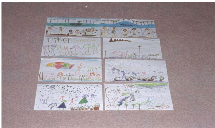
«ΤΟ ΜΑΖΕΜΑ ΤΩΝ ΕΛΑΙΩΝ ΕΝ ΜΥΤΙΛΗΝΗ»