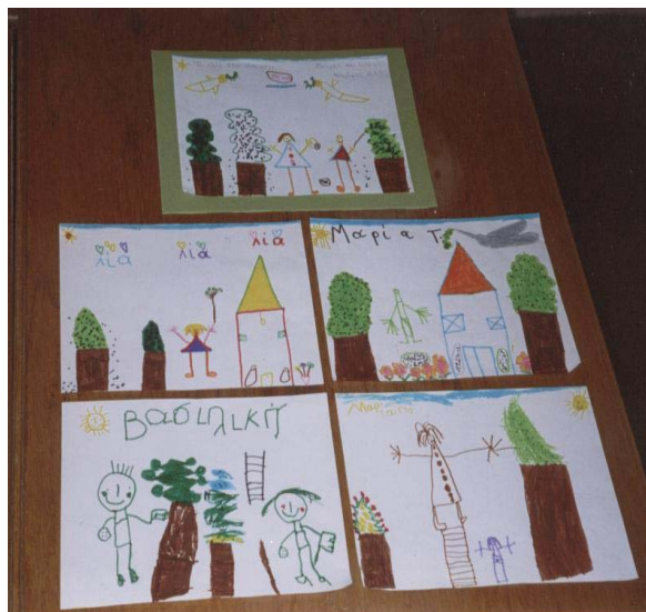
ΜΝΗΜΕΣ ΚΑΙ ΕΜΠΕΙΡΙΕΣ