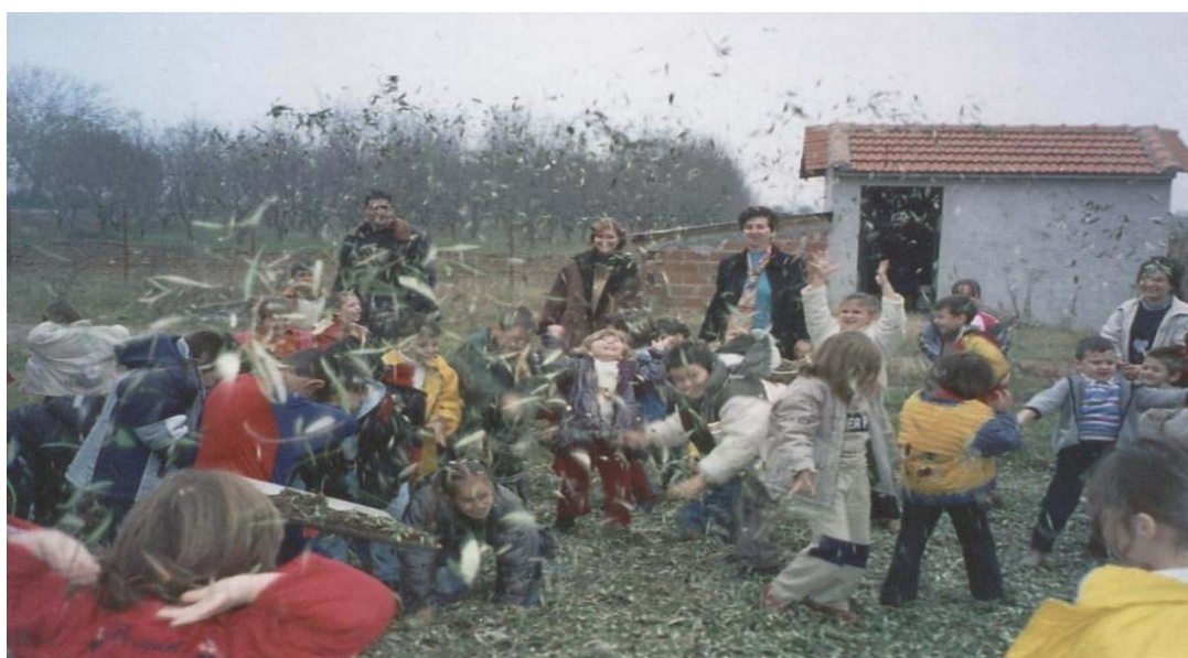
ΠΑΙΖΟΝΤΑΣ ΜΕ ΤΑ ΦΥΛΛΑ